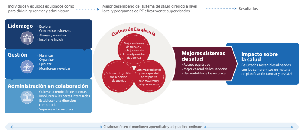
Figura 1. Modelo conceptual: Dirigir, gerenciar y gobernar para obtener resultados 10

Dado que no existen definiciones universalmente aceptadas del liderazgo y la gestión, es útil pensar en los comportamientos y prácticas que determinan la eficacia del liderazgo y la gestión (Tabla 1). Reforzar la capacidad de dirigir y gerenciar implica mejorar la capacidad de los individuos de realizar eficazmente estas prácticas. Aunque este informe se centra en el liderazgo y la gestión, la gobernanza colaborativa es un complemento importante de estas funciones, por lo que se la incluye en el modelo para ofrecer una imagen más completa. La Reseña del Entorno propicio para las PAI describe la gobernanza colaborativa como la forma en que las diferentes partes interesadas trabajan conjuntamente en una toma de decisiones en la que se busca el consenso que logra avances en los temas de planificación familiar voluntaria. El concepto más amplio de gobernanza colaborativa va más allá del alcance de este informe, pero los líderes y los gerentes pueden contribuir al buen gobierno aplicando las prácticas de gobierno que están dentro de su esfera de influencia.