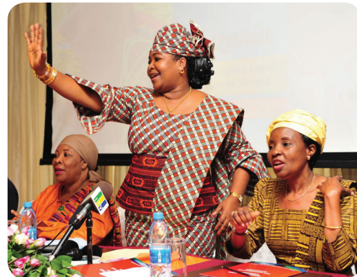
2012, Humphreys International Limited

Leis, regulamentos, códigos e políticas que afetam as operações de um sistema de saúde variam desde aqueles que decidem sobre direitos de importação e alocações orçamentárias, concursos e compras de contraceptivos a nível ministerial, aos que definem como o pessoal de saúde ao nível dos cuidados primários usa seu o tempo de trabalho e qual a qualidade do tratamento que os clientes recebem nas unidades sanitárias. Muitas vezes as barreiras para aceder aos serviços de saúde de alta qualidade têm suas raízes em políticas inexistentes, inadequadas, ou conflitantes (Cross et al., 2001). As Tabelas 1-3 fornecem exemplos de três níveis de políticas da Ásia, América Latina e África Subsaariana.