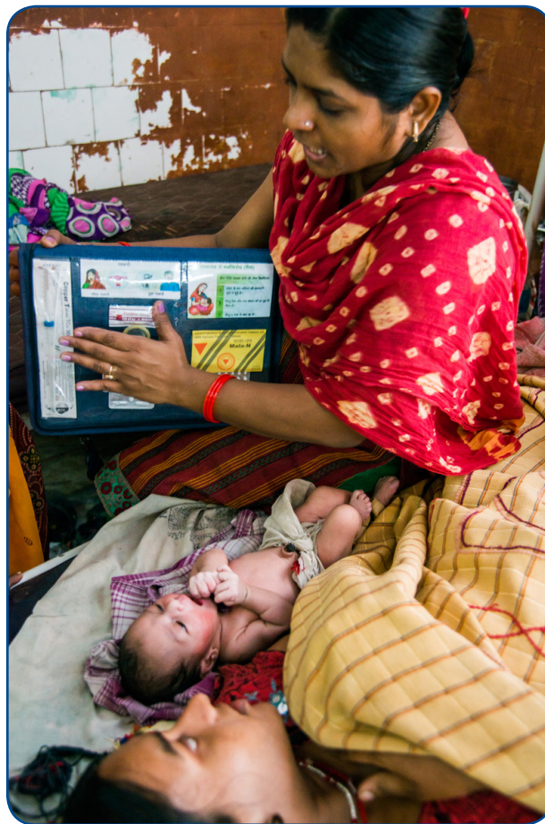
Madres con sus hijos recién nacidos en el área postnatal del hospital del distrito en Arrah, Bihar.

La oferta de servicios de métodos anticoncepción modernos como parte de la atención proporcionada durante los nacimientos aumenta el uso de anticonceptivos posparto y, probablemente, reduce tanto los embarazos no planeados como los embarazos poco espaciados. 1,2 Los embarazos no planeados y los no espaciados suficientemente suponen una cuestión de salud pública ya que se asocian con un aumento en la mortalidad y morbilidad maternal, de niños y neonatos. 3-5 Después de un nacimiento con vida, se recomienda un intervalo de al menos 24 meses antes de tratar de volver a quedar embarazada, en base a una investigación realizada por la Organización Mundial de la Salud (OMS), con el objetivo de reducir el riesgo de un resultado negativo prenatal ya sea para el niño o la madre. 6 A pesar de esta evidencia, el 61 % de las mujeres no utilizan ningún método efectivo de anticoncepción, en los 24 meses posparto, para evitar un embarazo no planeado. 7