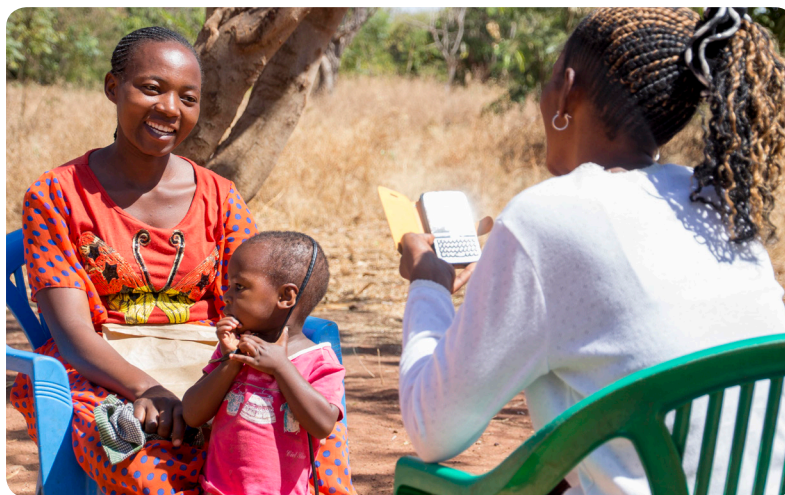
Um trabalhador de saúde comunitário usa o aplicativo móvel D-tree International para fornecer serviços abrangentes de planejamento familiar a um cliente em Shinyanga, na Tanzânia.

Sistemas de Informação de Gerenciamento de Saúde nacionais permitem análise atempada, visualização e comunicação de dados. Muitos países estão investindo em grandes HMIS digitais, como o District Health Information Systems 2 (sistema distrital de informação de saúde - DHIS 2) e em sistemas digitais de informação em recursos humanos, como o Health Workforce Information Solutions– iHRIS (veja Tabela 2). Estes sistemas de informação digital de saúde, frequentemente complementados por painéis interativos de dados com mapeamento GIS (sistema de informação geográfica), possibilitam acesso atempado a dados em nível nacional, que podem ser usados para apoiar decisões mais granulares sobre como alocar recursos, onde determinar intervenções e eventualmente ajustar objetivos de desempenho. Apesar de DHIS 2 e iHRIS poderem e deverem incluir indicadores e dados de planejamento familiar, nem todos os países estão atualmente impulsionando essas plataformas para obter esta informação.