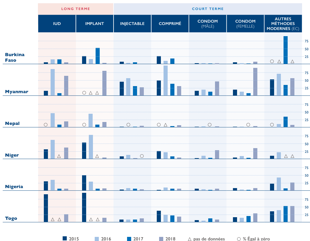
Figure 1: Pourcentage d'établissements en rupture de stock, selon la méthode proposée, le jour de l'évaluation

Les ruptures de stock de produits contraceptifs populaires sont courantes et persistantes dans de nombreux pays (figure 1). Un examen des défis de la chaîne d'approvisionnement dans les pays à revenu faible et intermédiaire (PRFI) a conclu que diverses inefficacités et goulots d'étranglement dans la chaîne d'approvisionnement contribuent de manière significative à des taux de rupture de stock élevés pour les contraceptifs modernes. 2 L'établissement et le maintien d'une gestion efficace de la chaîne d'approvisionnement sont essentiels pour rendre les contraceptifs modernes disponibles et ainsi aider les individus à atteindre leurs objectifs de reproduction. 3