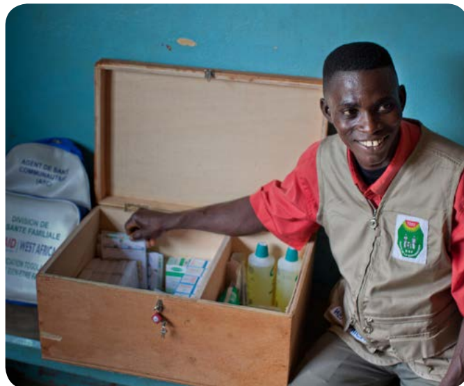
Um agente comunitário de saúde do Togo com sua caixa de medicamentos e materiais de saúde.

A integração dos ACSs ao sistema de saúde é uma das várias práticas de grande impacto (PGIs) comprovadas para o planejamento familiar, identificadas por um grupo técnico consultivo de especialistas internacionais. Uma prática comprovada tem evidência suficiente para recomendar sua ampla implementação como parte de uma estratégia abrangente de planejamento familiar, sempre que acompanhada do monitoramento da cobertura, da qualidade, e dos custos, bem como de pesquisa de implementação para fortalecer o impacto (PGIs, 2014). Para mais informações sobre outras PGIs, leia https://www.fphighimpactpractices.org/overview .