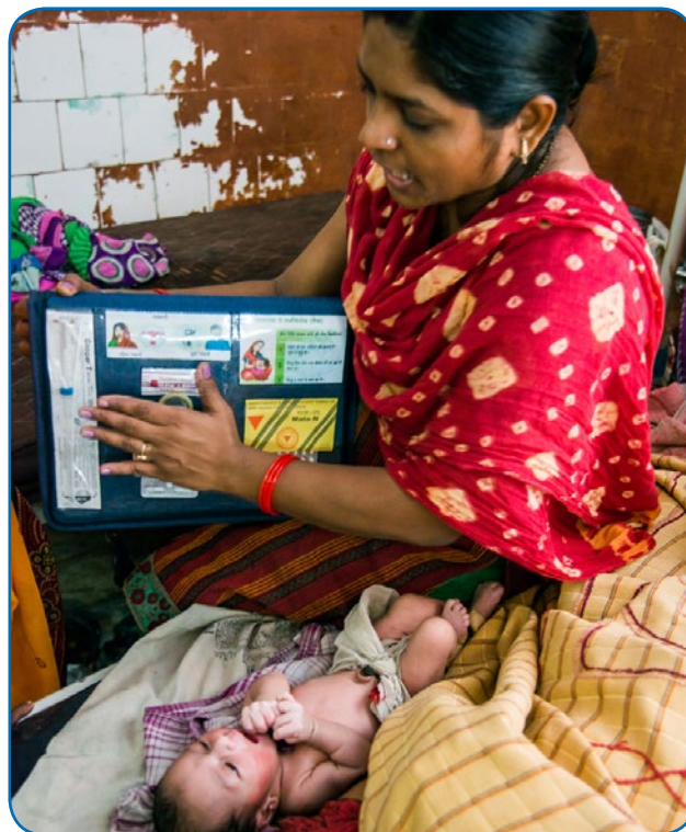
Des mères et leurs nouveaux-nés au service néo-natal de l'hôpital régional d'Arrah, Bihar.

Plusieurs raisons expliquent pourquoi les femmes n'utilisent pas de moyens de contraception efficaces lors de la période suivant un accouchement, comme les normes socioculturelles et sexospécifiques qui influencent les pratiques postnatales, 8,9 le moment de la reprise de l'activité sexuelle, 10 les pratiques d'allaitement et les idées fausses concernant l'aménorrhée liée à l'allaitement, 8,11 ainsi que le manque d'accès aux services de contraception (voir Figure 1). Le présent mémoire d'information consacré à la pratique à haut impact (PHI) en matière de planification familiale résume les données probantes et fournit des conseils de mise en œuvre en vue de proposer de façon proactive une planification familiale dans le cadre des soins pendant et immédiatement après l'accouchement, une période généralement appelée post-partum immédiat. (L'offre de services lors de la période post-partum est une approche classique visant à combler les lacunes en matière d'accès aux services ; voir, par exemple, le mémoire d'information consacré à la pratique à haut impact en matière de planification familiale et à la vaccination.)