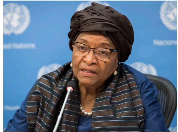
President Ellen Johnson Sirleaf of Liberia

El compromiso demostrable con la planificación familiar fortalece el entorno habilitador en el que se implementan los programas y las políticas. Países tales como Indonesia, México y Turquía tienen compromisos duraderos con la planificación familiar, como lo demuestra su uso de recursos nacionales, el trabajo hacia el fortalecimiento de sistemas en los niveles subnacionales, y los aumentos en las tasas de prevalencia de anticonceptivos (Alkenbrack y Shepherd, 2005; Ozvaris y otros, 2004; Seltzer, 2002). Independientemente de su desempeño anterior, los países pueden sufrir un estancamiento a medida que su compromiso con la planificación familiar disminuye con el paso del tiempo (Putjuk, 2014).